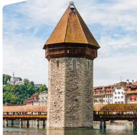
Wasserturm, Kappelbrücke, 6002 Luzern

Helmedica AG ist ein führendes Schweizer eHealth-Unternehmen, das medizinisches Know-how in moderne IT übersetzt. Mit Rockethealth entwickelt sie eine zukunftsweisende Praxissoftware und ist massgeblich an der Realisierung der Patienten-App «Benecura» beteiligt.